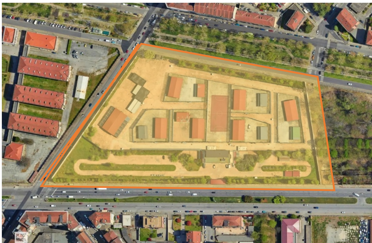
Fig. 1 - Vista in pianta del CPR "Brunelleschi" di Torino (Via Santa Maria Mazzarello, 31, 10142 Torino)

OGGETTO: Relazione sulla visita al CPR di Torino del 19 luglio 2025, a cura della Commissione CPR dell'Unione Camere Penali Italiane e della Commissione Carcere e Sorveglianza della Camera Penale "Vittorio Chiusano"